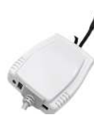
Датчик температуры и влажности